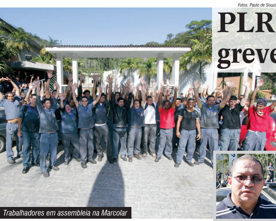
Trabalhadores em assembleia na Marcolar