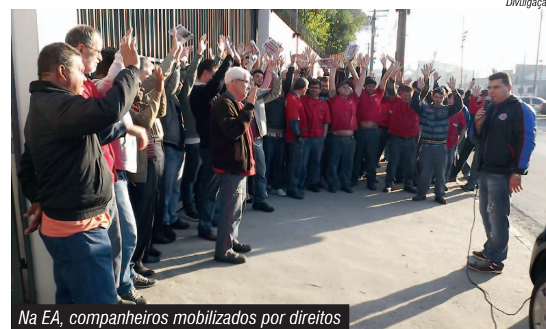
Na EA, companheiros mobilizados por direitos

Os companheiros na EA Engenharia, em Diadema, aprovaram pauta de reivindicações para a primeira negociação na empresa desde o seu cadastro, há 60 dias.