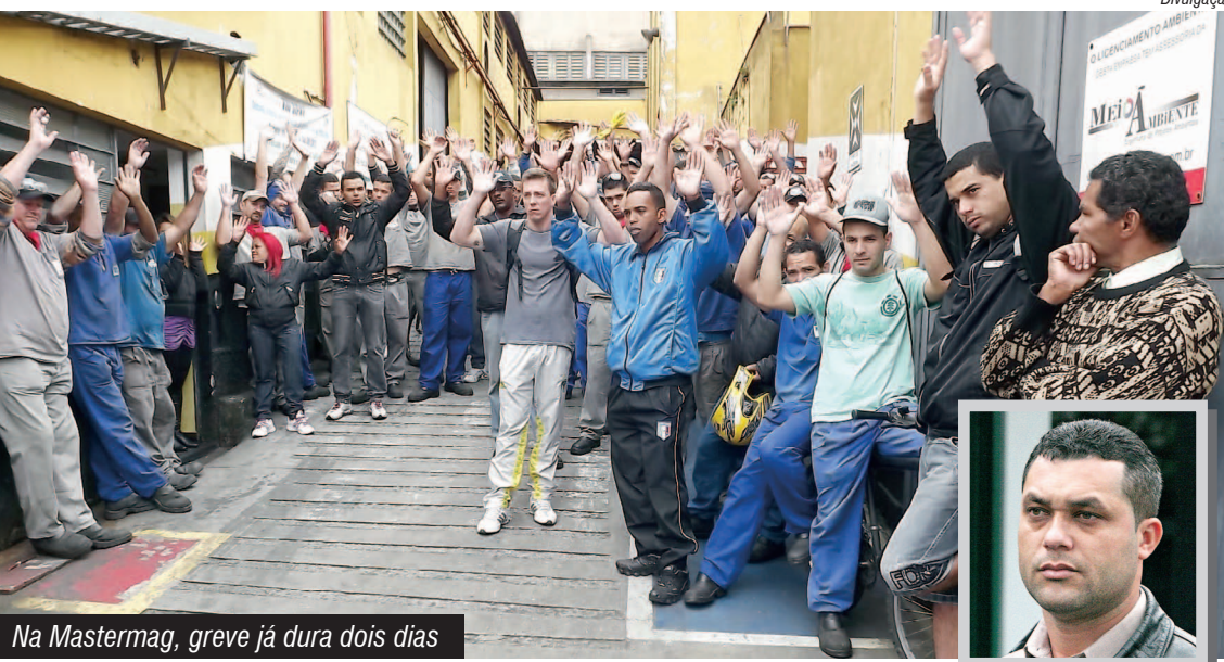
Na Mastermag, greve já dura dois dias

A Mastermag contrata 70 metalúrgicos e faz parte do Grupo 3.